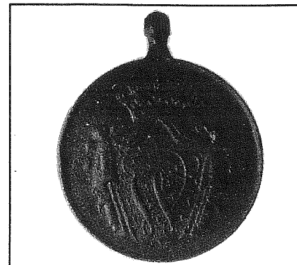
Afb.2: Bronzen medaille voor trouwe dienst (12 jaar) tot de rang van 2e luitenant. Tekst: 'VOOR TROUWEN DIENST'. Datering: 1825-1851 (37 mm).