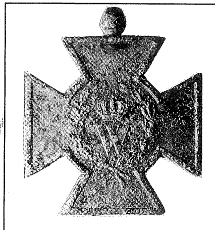
Afb.1: Onderscheiding 'Het Metalen Kruis' 1830-1831, gegoten uit metaal van twee buitgemaakte kanonnen.