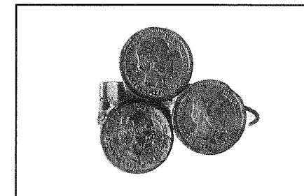
Afb.4: Muntsieraad, vervaardigd uit drie zilveren stuiverijes van Willem III.