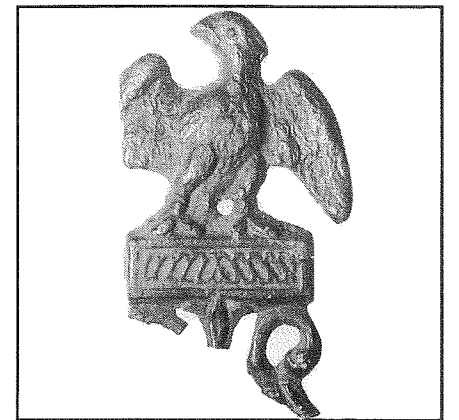
Afb.5: Bronzen beslagstuk met de Napoleonische adelaar (ca.1800).