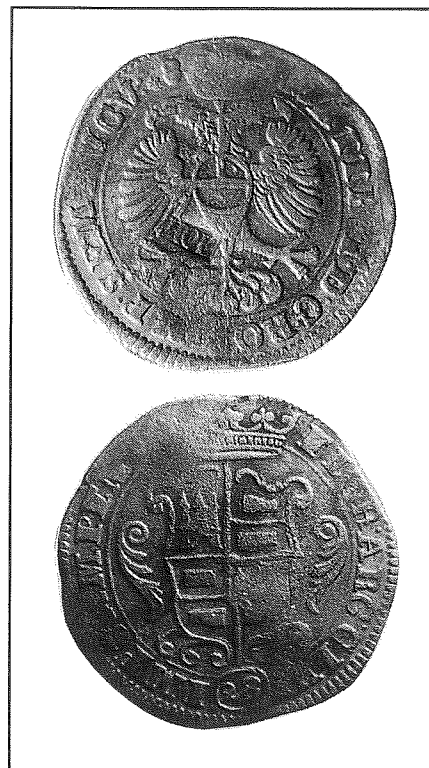
Afb.10: Zilveren 28-stuiverstuk, reken maar dat dit een signaal veroorzaakte.