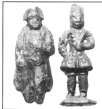
Afb.9: Twee lood/tinnen miniaturen, links Napoleon (19e eeuw).