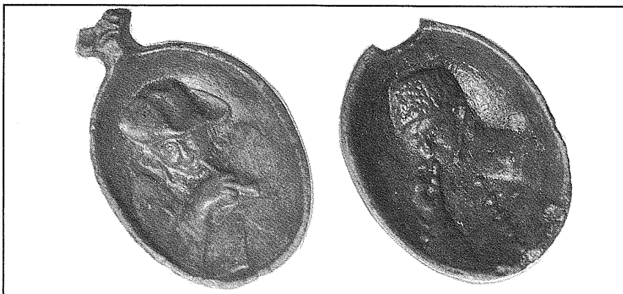
Afb.8: Twee tinnen lepelbakken (19e eeuw), beide met rokerstaferelen.