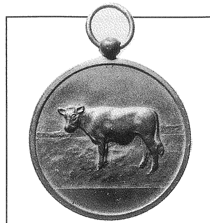
Afb.11: Medaille ten behoeve van veekeuring. Een stuk waarvan de eigenaar is te achterhalen is altijd bijzonder.