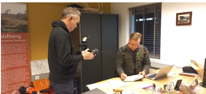
Filmopname uitleg werkzaamheden in deelgebied Kooi van Pen