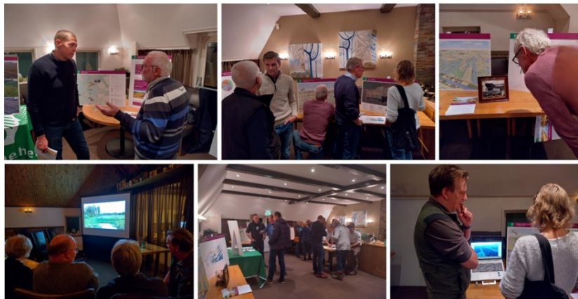
Sfeerimpressie inloopbijeenkomst november 2023

Deze nieuwe fase gaat het landschappelijke aanzicht van de gebieden aanzienlijk veranderen. Dit hebben we met foto's, vogelvluchttekeningen en dronebeelden van uitgevoerde werkzaamheden inzichtelijk gemaakt. Aan de diverse tafels kregen de bezoekers uitleg over de plannen, de geplande werkzaamheden en de planning. Samen met alle waardevolle gesprekken geeft het de bewoners een goed beeld wat dat betekent voor hun achtertuin.